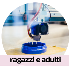
ragazzi e adulti

venerdì 9 aprile / ore 16:30 DIRE, FARE, COMUNICARE (parte 2) storie e parole