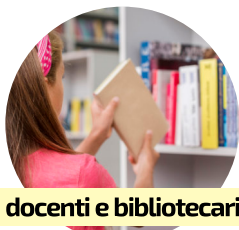
docenti e bibliotecari