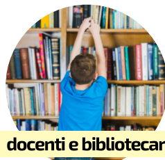
docenti e bibliotecari

lunedì 22 marzo / ore 17:00 COSTRUIRE GIOVANI LETTORI (parte 1) incontro di formazione